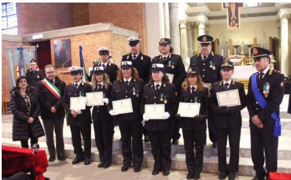
Le celebrazioni del 2014 per San Sebastiano della Polizia Locale di Lecco