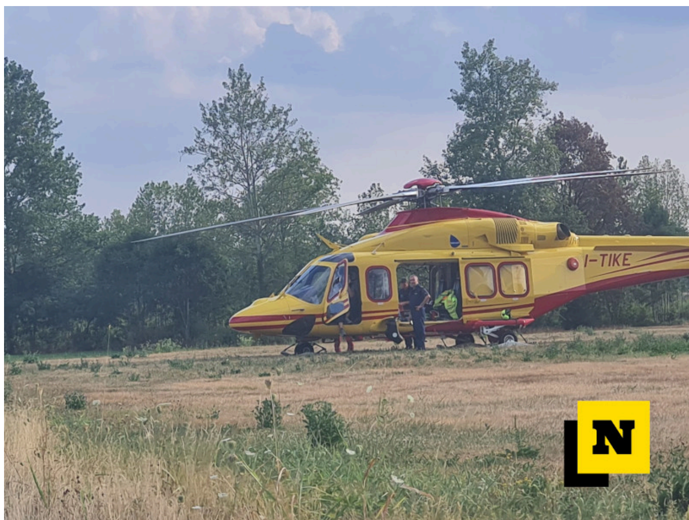
L'elisoccorso giunto da Como, atterrato nei pressi dell'azienda