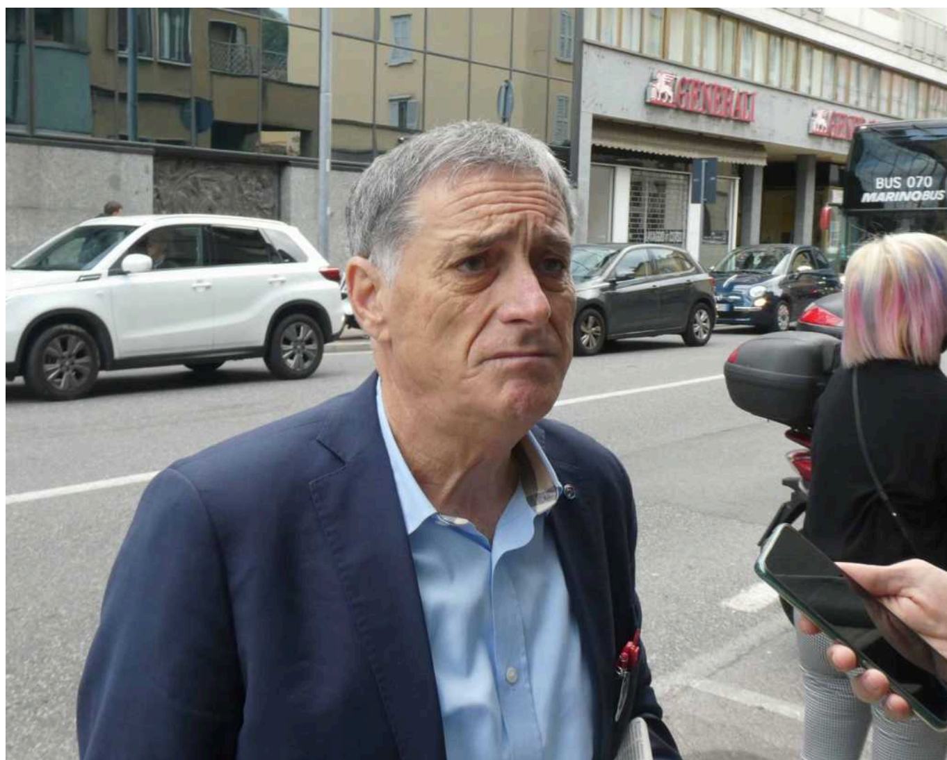
Rocco Palombella a Lecco

LECCO - Già da qualche settimana è pienamente operativa la nuova sede della Uilm del Lario a Lecco, ma per l'inaugurazione ufficiale si attendeva un momento speciale come quello di questa mattina, venerdì, alla presenza del segretario nazionale Rocco Palombella .