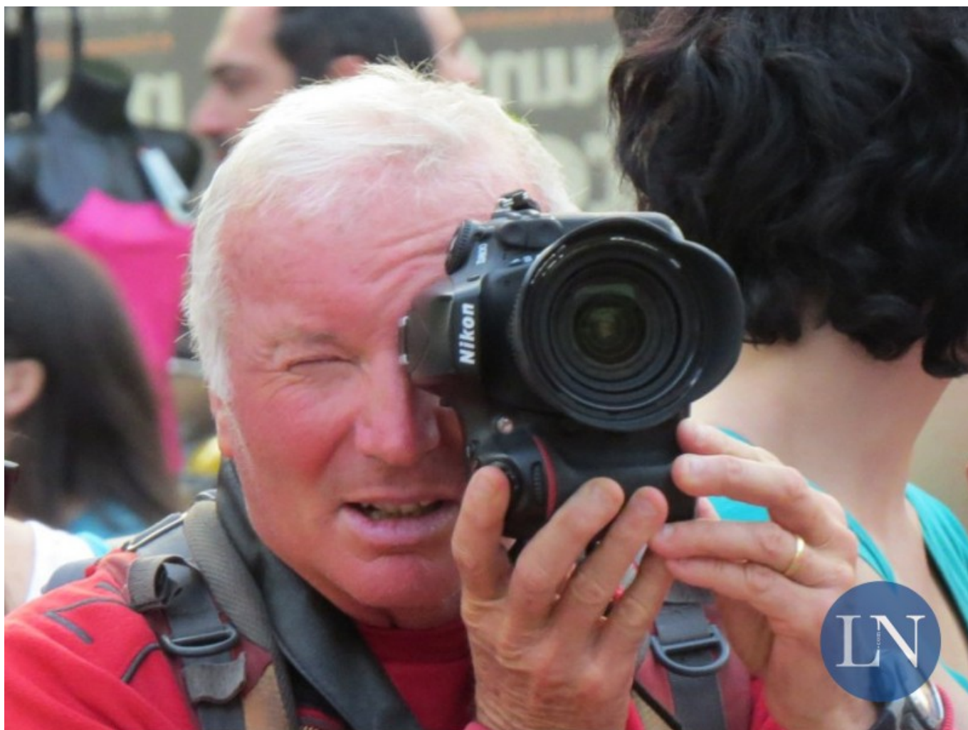
Il fotografo Mauro Lanfranchi

“L’immagine ha per protagonista la neve, che elemento etereo e delicato, per sua stessa natura vocata ad assumere le forme degli oggetti su cui si posa, pur modificandola, diviene in questo caso forma, scultura, decorazione e disegno essa stessa - si legge nella motivazione -. Opera di notevole pregio grafico, in cui la figura dell’elemento umano conferisce la giusta dimensione alla suggestiva opera d’arte creata dalla neve e dal vento”.