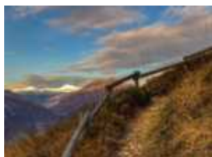
Il sentiero dei fiori