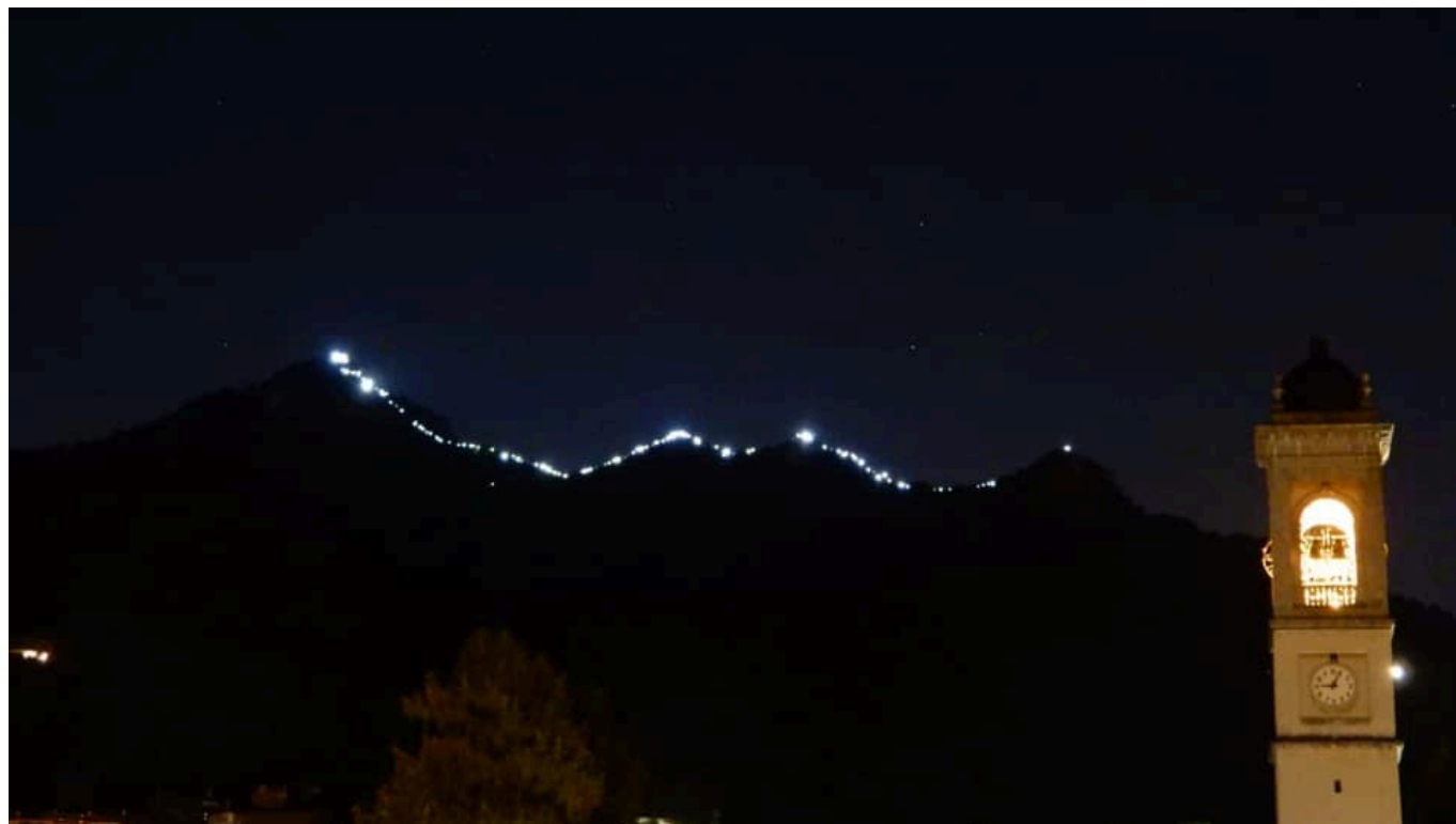
La cresta illuminata

E' così che il Gruppo Podistico Libertà ha voluto celebrare i propri 40 anni di storia, risalendo con una fiaccolata notturna la cresta del Monte Barro. Una storia iniziata nel 1979 e che prosegue ancora oggi con numerosi iscritti e simpatizzanti.