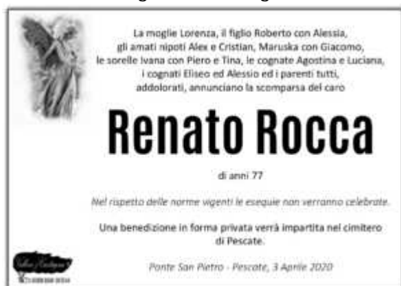
Renato Rocca - Pescate