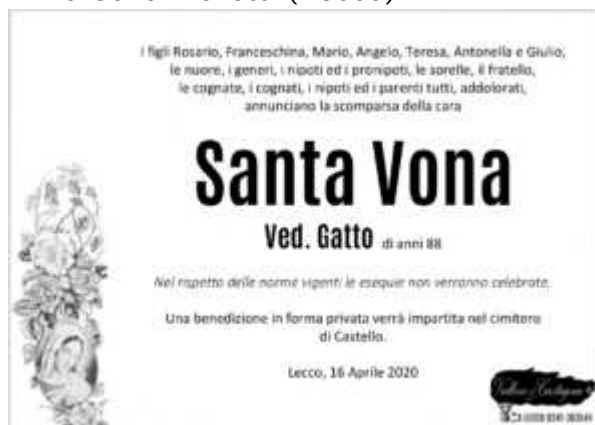
Santa Vona (Lecco)