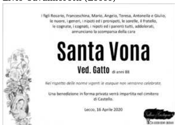
Santa Vona (Lecco)