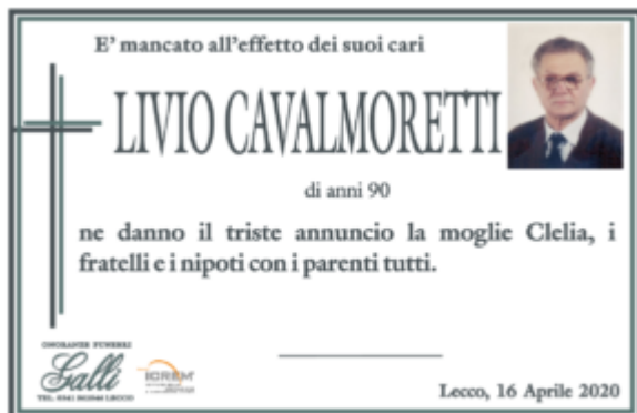
Livio Cavalmoretti (Lecco)