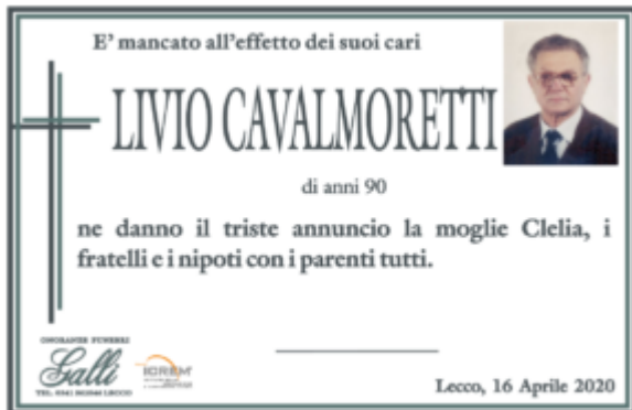
Livio Cavalmoretti (Lecco)