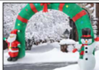
Fac simile arco accesso

Misure indicative da verificare ad avvenuta installazione del villaggio