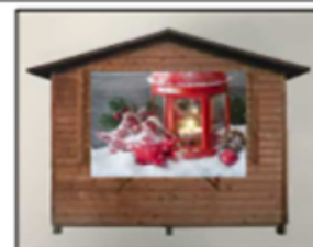
Fac simile Retro casette