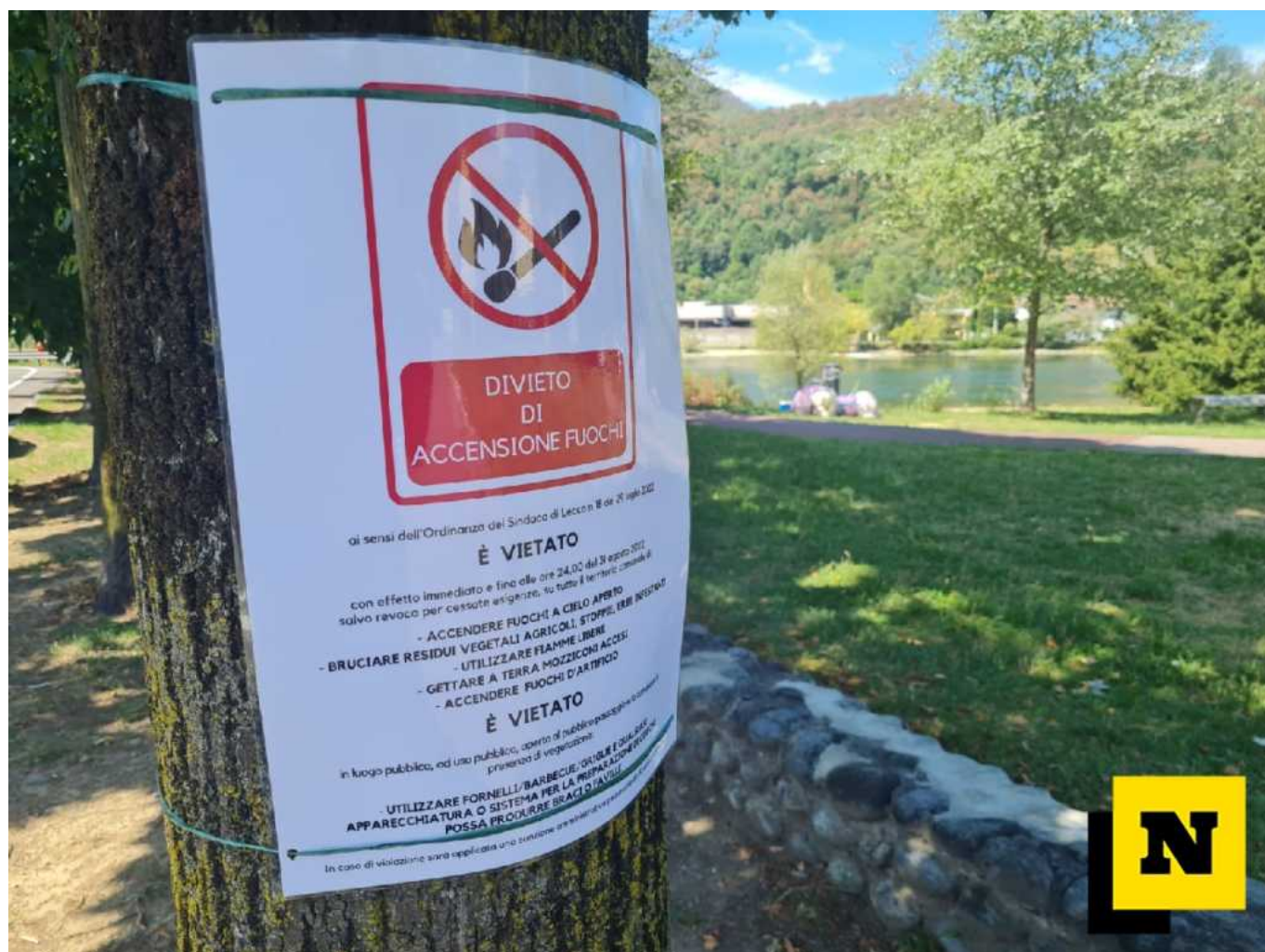
Uno dei tanti cartelli posti del Comune per segnalare il divieto di accensione fuochi

LECCO - Ferragosto fuori città per tanti quello trascorso a Lecco e anche se non sono mancati i lecchesi e non che hanno tenuto fede alla tradizione del picnic estivo scegliendo come meta le aree di verde lungo le rive del capoluogo.