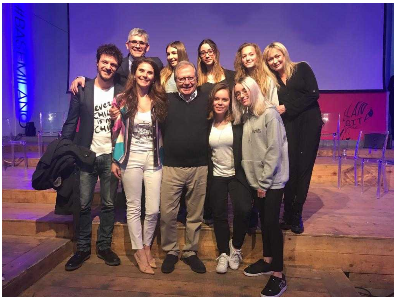
La professoressa Nuri ( a sx) e cinque alunne della classe 1°C.

MILANO - Grande soddisfazione per il liceo artistico Medardo Rosso di Lecco : un logo ideato da tre alunne della classe 1°C dell'istituto è stato segnalato durante l'evento #Zerobullismo che si è svolto ieri al Base Milano , durante la digital week organizzata nel capoluogo lombardo.