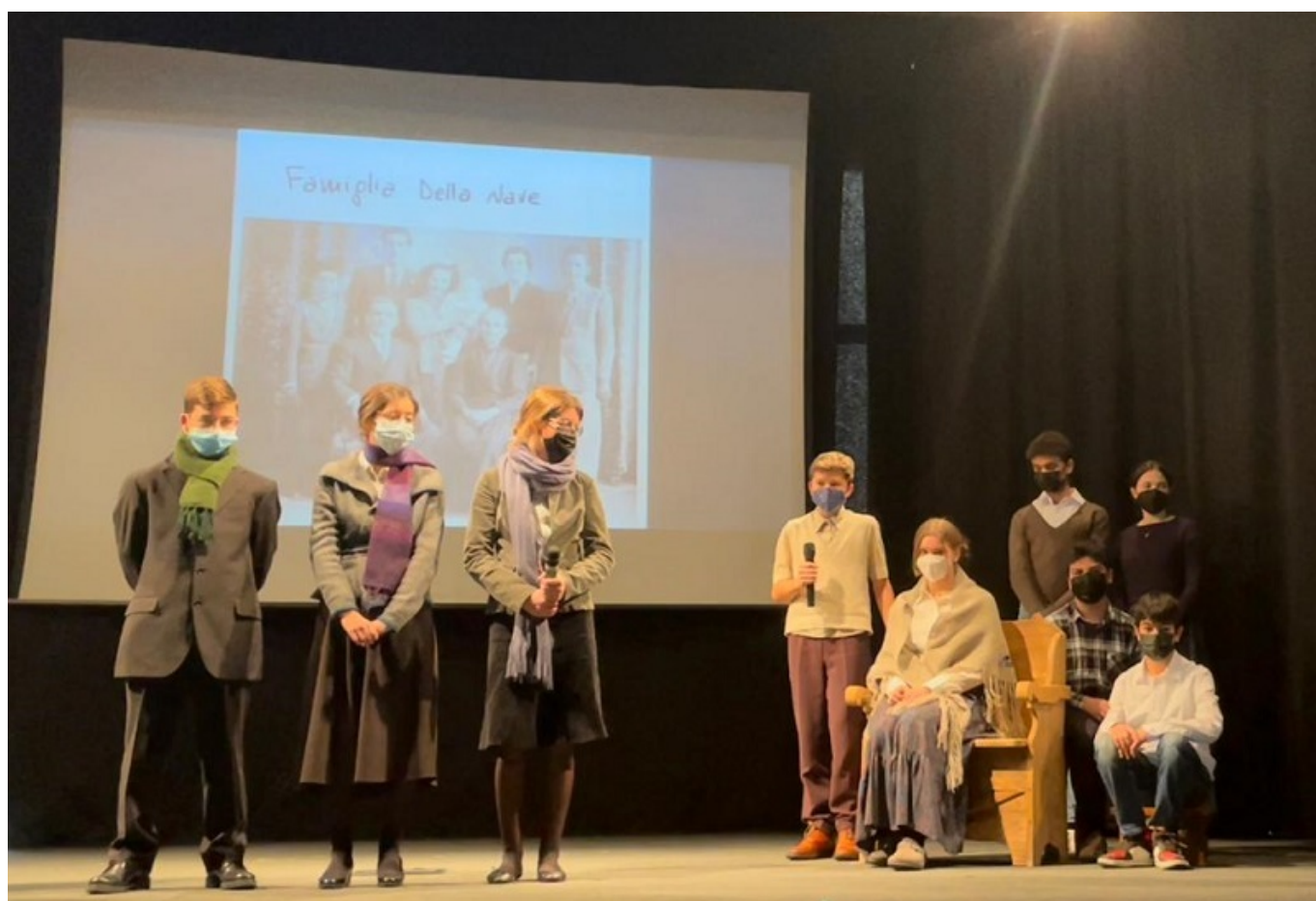
La rappresentazione teatrale

Dopo due anni di pandemia che hanno portato ad uno stop forzato di gran parte dei progetti, il bilancio di fine anno dell'istituto Galileo Galilei è dunque più che positivo.