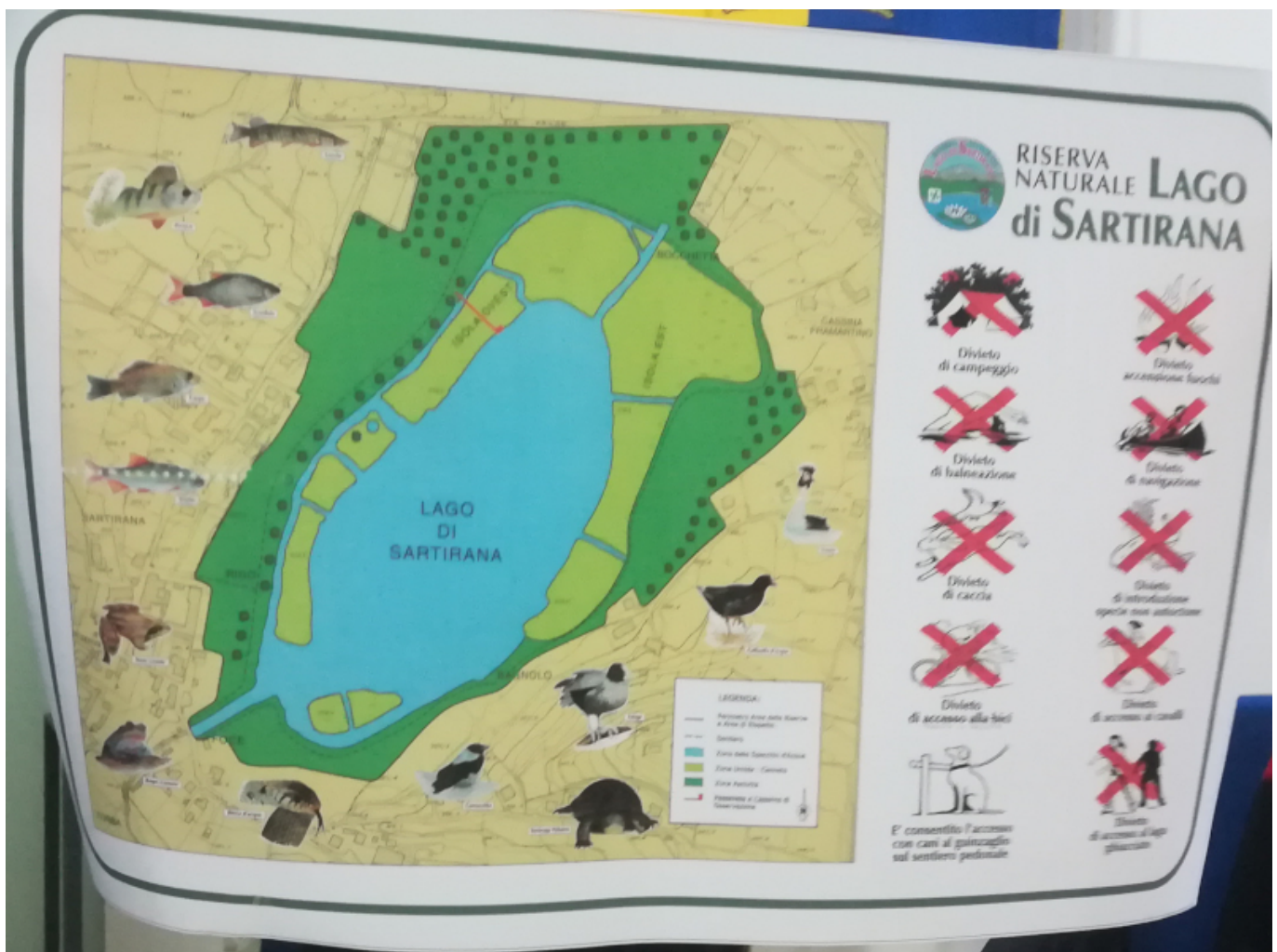
Il nuovo cartellone di accesso alla riserva di Sartirana

MERATE - Sì ai cani, seppure portati a guinzaglio, no a bici e cavalli, con l'accesso esteso dalle 6 alle 24.