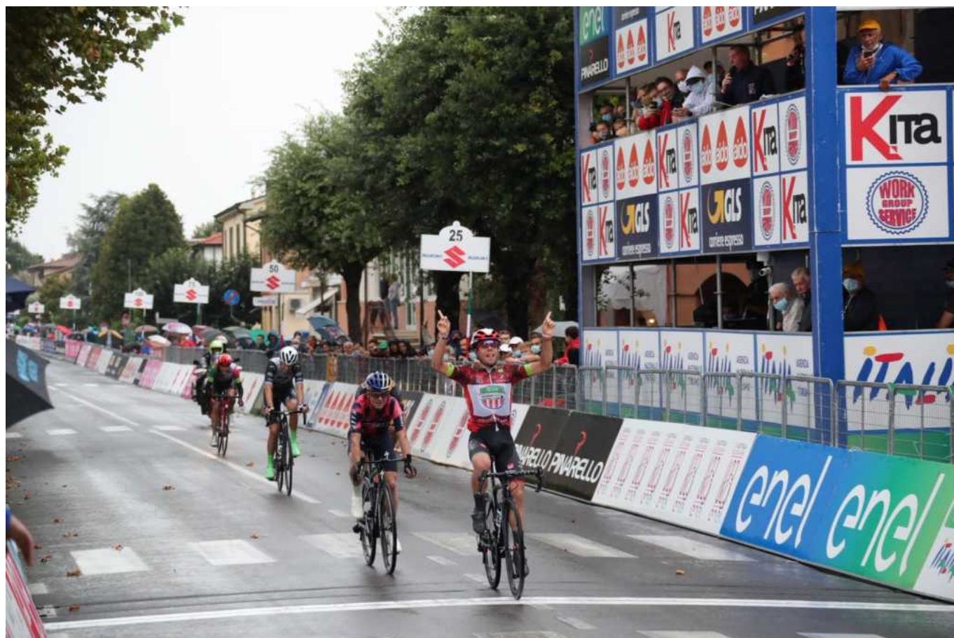
L'arrivo al traguardo della terza tappa, lunedì.

Il 'Giro' Giovani arriverà questa settimana anche nel lecchese con ben due tappe: la sesta tappa giovedì 3 settembre da Colico a Colico, con il giro completo del lago di Como, e venerdì la settima tappa da Barzio a Montespluga.