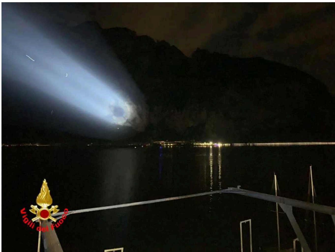
Vigili del Fuoco, luce fotoelettrica dal Moregallo al san Martino