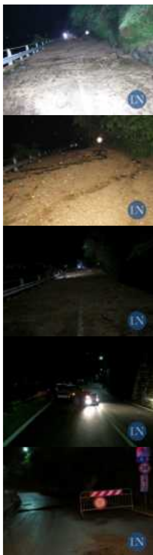
La frana che ha interessato la SP66 (Bellano - Vendrogno) in località Valletta