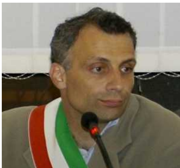
Il sindaco di Dervio, Davide Vassena.

Viene riproposta l'imposta di soggiorno a carico dei turisti, i cui introiti vengono destinati al miglioramento dei servizi e delle strutture ad uso turistico. I contributi dagli enti superiori sono ormai limitati per lo più al settore dei servizi sociali, in virtù della partecipazione del Comune ai piani sovracomunali di programmazione dei vari servizi.