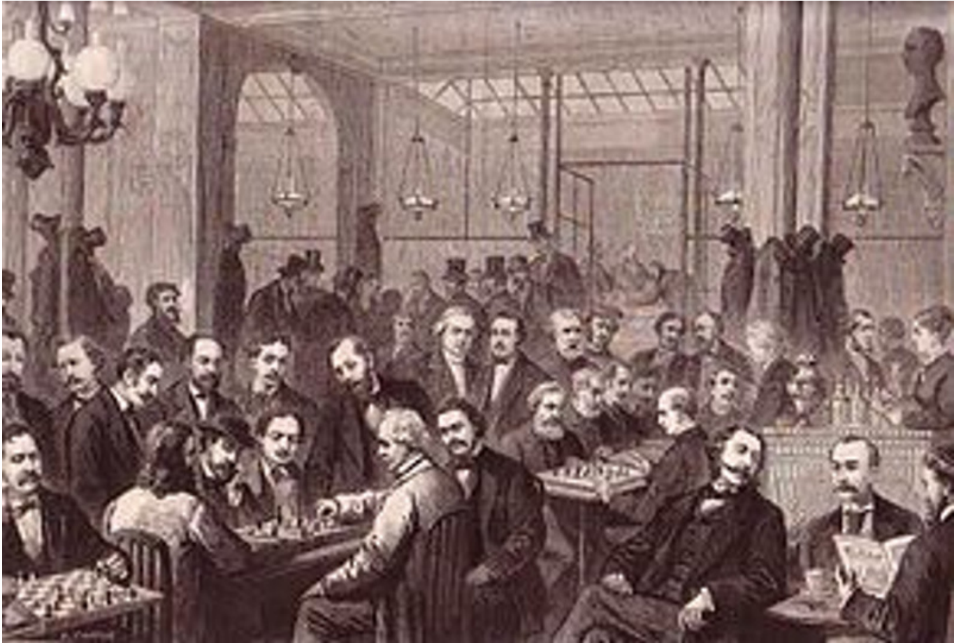
Il Café de la Règence