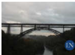
Il ponte San Michele