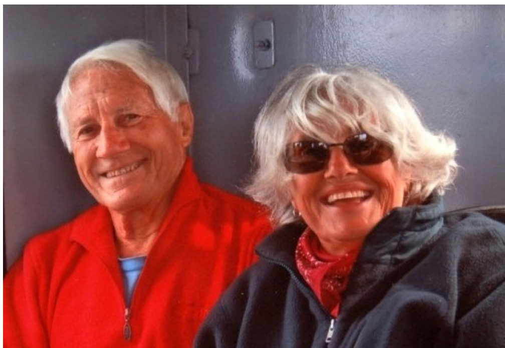
Il grande alpinista e esploratore Walter Bonatti in una foto che lo ritrae accanto a Rossana Podestà.

LIERNA - Inizierà nel segno e nel nome di Walter Bonatti il nuovo anno a Lierna. Per iniziativa dell'associazione “Lettelariamente” sabato prossimo 2 gennaio, con inizio alle ore 20.45, presso la mensa delle scuole in via Parodi verrà infatti proiettato il film documentario di Rossana Podestà e Paola Nessi “W di Walter”.