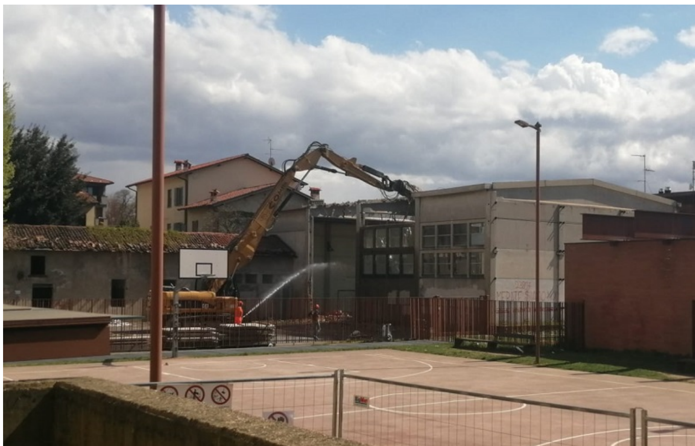
Ruspe al lavoro per abbattere la vecchia palestra del Collegio Manzoni

Il sindaco ricorda anche come nell'ultima variazione di bilancio, discussa in consiglio lunedì scorso (qui la cronaca del Consiglio) , sono stati stanziati anche dei fondi per l'acquisto di materiali per l'attività sportiva da svolgere in palestra. "Con questo nuovo spazio andremo a colmare non solo una lacuna della scuola (gli studenti ora utilizzano per l'attività di educazione fisica la palestrina interna al collegio Manzoni, ndr), ma a rispondere anche alle esigenze delle associazioni sportive e della cittadinanza".