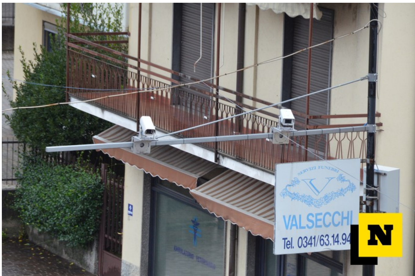
Le telecamere installate in corso Europa all'incrocio con via Lavello